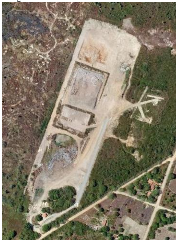
Figura 1: Vista de cima do Lixão de Pacatuba

Com o intuito de compreender melhor a realidade dos catadores da associação e ampliar o entendimento do funcionamento e importância desses trabalhadores, foi feita uma segunda visita aos associados, no local onde fazem a separação dos recicláveis, localizado na comunidade da Alvorada. Foi aplicado um questionário semiestruturado com 19 questões abertas e fechadas para identificar o perfil dos catadores da Associação de Pacatuba. A coleta consistiu de uma amostra de 10 entrevistados, o que representa aproximadamente 50% dos associados.